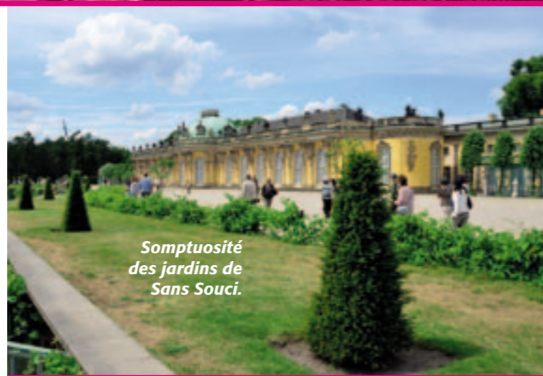
Somptuosité des jardins de Sans Souci.

Une visite dans ce commerce s'impose, d'autant plus qu'il est à