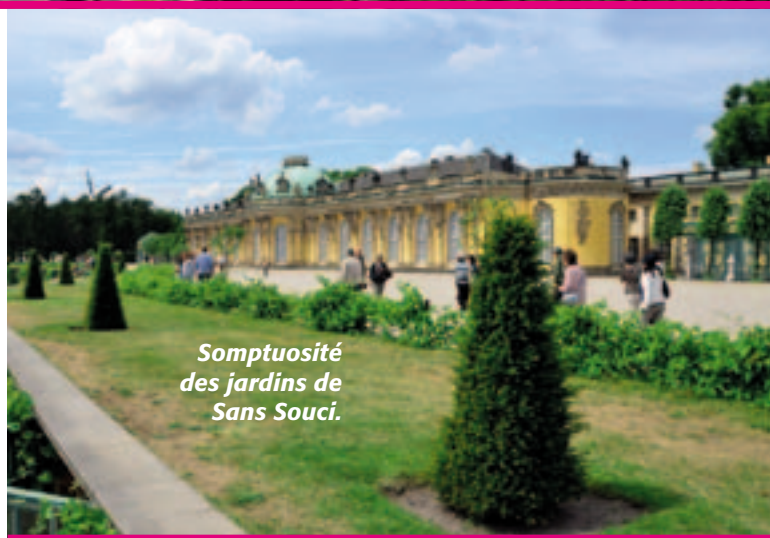
Somptuosité des jardins de Sans Souci.

Une visite dans ce commerce s'impose, d'autant plus qu'il est à