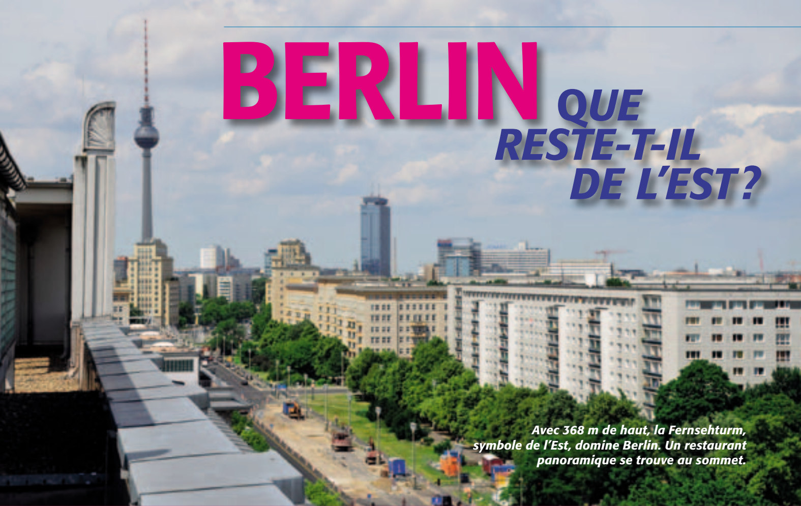
Avec 368 m de haut, la Fernsehturm, symbole de l'Est, domine Berlin. Un restaurant panoramique se trouve au sommet.

PAR CLAUDE-YVES REYMOND partir-magazine.com